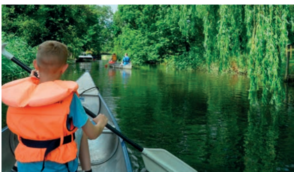
Det er muligt at sejle i kano på Køge Å.

Museet KØS ligger i centrum af Køge og er et af de