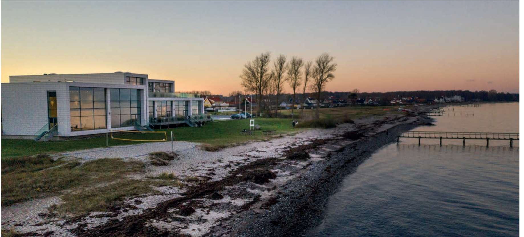
Bæredygtighed er i fokus på de seks danske Sinatur-hoteller, hvor man blandt andet arbejder for at reducere madspil og købe lokale råvarer.