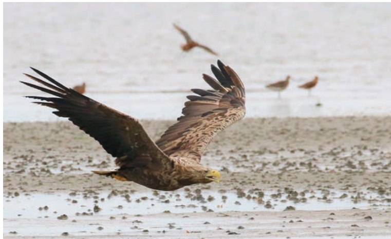
Der er rig mulighed for at se og fotografere havørne på Fanø.

Vores første stop er Harboøre. Beliggende i det nordlige Vestjylland er stationsbyen for mange