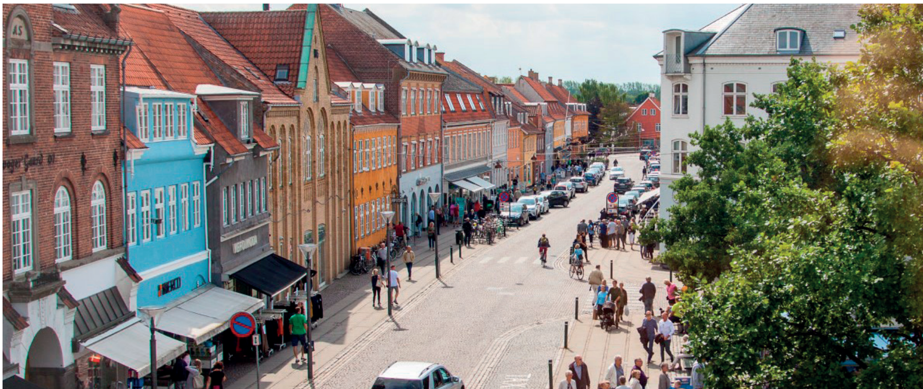
Køge er en af de bedst bevarede middelalderkøbstæder i Danmark og kåret til Danmarks hyggeligste handelsby 2020-2022.