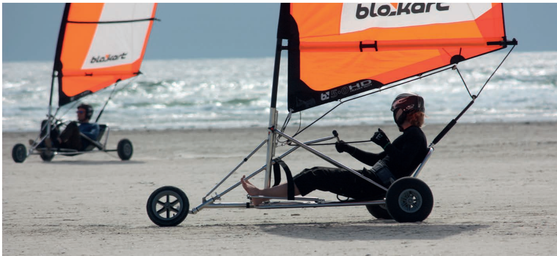
På Rømø's brede strand er det muligt at prøve kræfter med en mellemting mellem gokart og windsurfing.