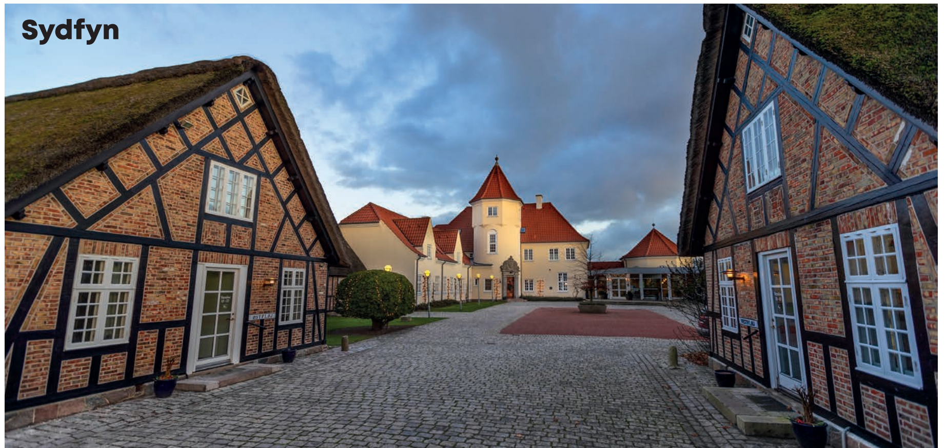
På halvøen Helnæs ligger hotellet Gl. Avernæs, der er næsten som taget ud af Disney-universet.