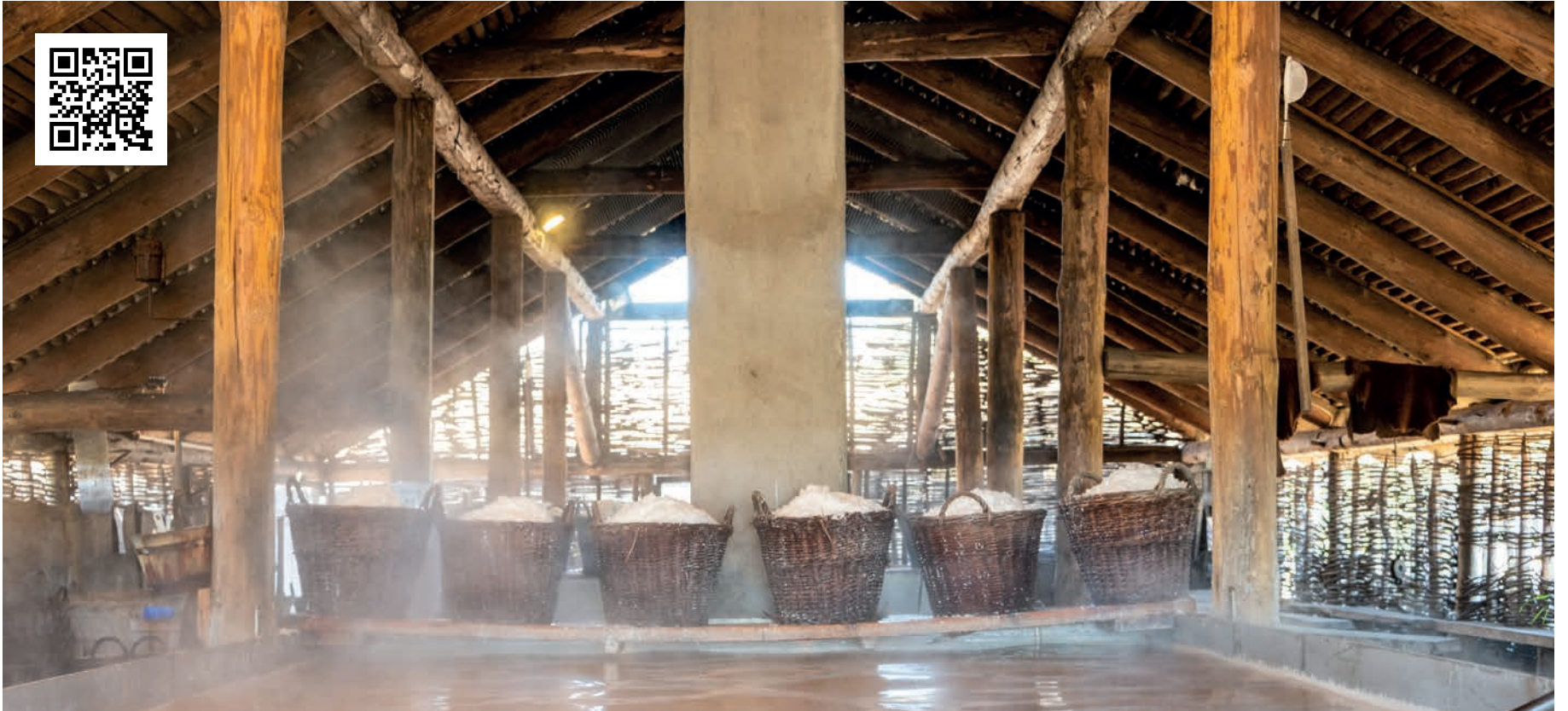
I år er det 30 år siden, at vi genoptog saltsydningen på Læsø.